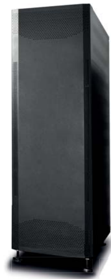
Banco de baterías UPO33HF-BC-8009-20